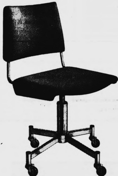
Albert Stoll, Giroflex Stuhlfabrik, Koblenz/AG

40 weitere GIROFLEX — vom einfachsten bis zum Luxusmodell. In Büromöbel-Fachgeschäften erhältlich.