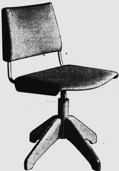
Albert Stoll, Giroflex Stuhlfabrik, Koblenz/AG

40 weitere GIROFLEX — vom einfachsten bis zum Luxusmodell. In Büromöbel-Fachgeschäften erhältlich.