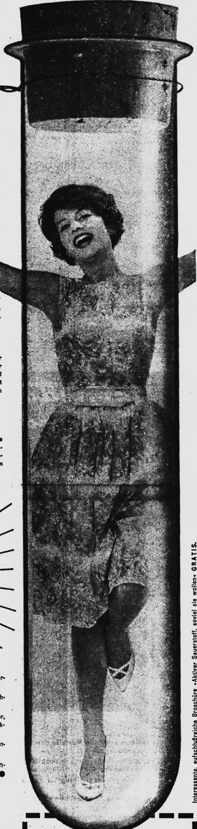
Interessante, aufschlußreiche Broschüre »Aktiver Sauerstoff, soviel sie wollen« GRATIS.

IKS Nr. 22228 Export: Intertred AG, Zürich 22 Copyright A. S. G. 21/60