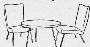
Ansprechende Rauchtisch-Gruppen, dazu bequeme Stühle und Fauteuils mit aparten Bezugsstoffen.

Sitzungstisch Mod. 6071 aus schönem Nussbaumholz. Platte massiv eingefasst. Stühle Mod. 392.