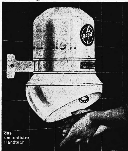
das unsichtbare Handtuch

Mit dem Baege-Handetrockner nie mehr schmutzige und zerrissene Handtücher.