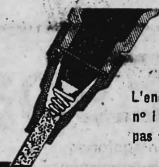
L'encre Jax n°1 n'est pas toxique

3 km d'écriture. Jax No 1 contient 3 fois plus d'encre liquide que les flacons remplis surtout d'ouate saturée d'encre.