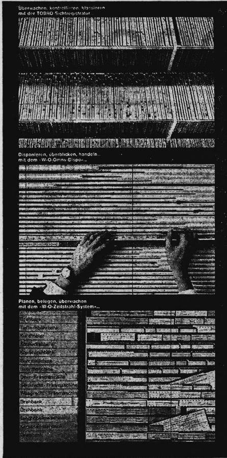
Überwachen, kontrollieren, klassieren mit der TOBRO Sichtregistrator