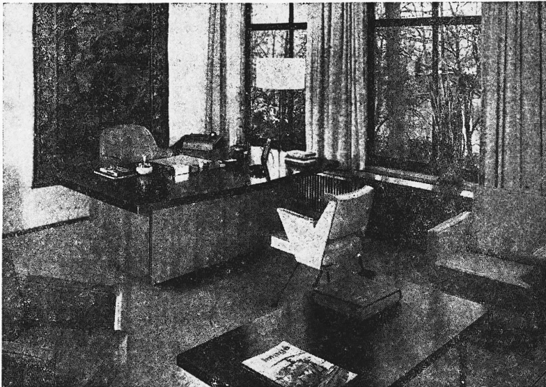
Dieses vorbildlich eingerichtete Direktionsbüro vermittelt ein Bild zeitgemässer Raumgestaltung. Es zeigt am praktischen Beispiel, wie leicht sich Stella-Möbel kombinieren lassen. Ein harmonischer Rahmen für konzentriertes Arbeiten. Entwurf Walter Frey, Architekt SWB, Basel

Verlangen auch Sie bitte unsere detaillierten Unterlagen über zeitgemässe Raumgestaltung mit STELLAFORM-Qualitäts-Möbeln. STELLA-Büromöbel erhalten Sie im guten Fachgeschäft.