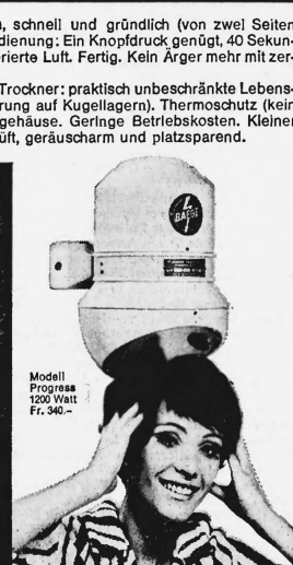
Modell Progress 1200 Watt Fr. 340.—

Baege-Händetrockner gehören in jeden fortschrittlichen Betrieb: Cafés, Restaurants, Hotels, Büros, Fabriken, Spitäler, Sanatorien, Warenhäuser, Kinos, Theater, Tankstellen usw.