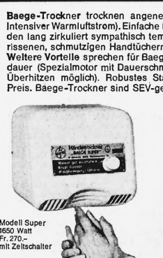
Modell Super 1650 Watt Fr. 270.— mit Zeitschalter