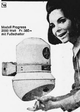
Modell Progress 2000 Watt Fr. 380.— mit Fußschalter