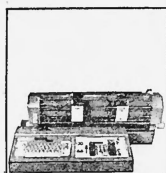
Preiskategorien von Fr. 6100.- bis ca. Fr. 98 000.-

Buchungsautomaten verschiedener Baureihen elektromechanischer und elektronischer Konstruktion mit 2-4 Grundoperationen, 2 - 256 Rechenwerken bzw. Speichern, Volltext oder Kurztext, von der einfachen Vorsteckeinrichtung über den photoelektrischen Kontoeinzug bis zur automatischen Saldolesung mit Magnetkonten, Anschluss von Karten- und Streifenlochern.