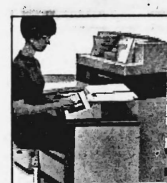
Preiskategorien von Fr. 72 200.- bis ca. Fr. 500 000.-

Leistungsfähige Computer der dritten Generation für die mittlere Datentechnik. Kernspeicherkapazität von 4 - 16 K. Programm- sowie Daten-Ein- und -Ausgabe mit Kasettenmagnetband, alphanumerischer Blockdrucker mit einer Geschwindigkeit von 50-60 Zeichen pro Sekunde. Mit und ohne Magnetkonto-Verarbeitung; Speicherkapazität pro Kontoseite 400 alphanumerische Stellen (800 je Kontoblatt). Volle Integration des Datenflusses durch Peripherie-Geräte.