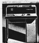
Preiskategorien von Fr. 2450.- bis ca. Fr. 150 000.-

Datenerfassungsgeräte in Offline-Techniken mit Lochkarten, Lochstreifen und optisch lesbaren Schriften. On-line-Terminals für Simplex- und Duplex-Verkehr mit EDV-Anlagen beliebiger Provenienz.