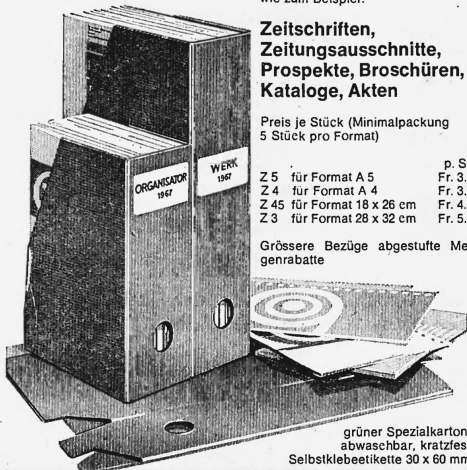
grüner Spezialkarton, abwaschbar, kratzfest Selbstklebeetikette 30 x 60 mm