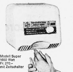
Modell Super 1650 Watt Fr. 270.— mit Zeitschalter

Weitere Vorteile sprechen für Baege-Trockner: praktisch unbeschränkte Lebensdauer (Spezialmotor mit Dauerschmierung auf Kugellagern). Thermoschutz (kein Überhitzen möglich). Robustes Stahlgehäuse. Geringe Betriebskosten. Kleiner Preis. Baege-Trockner sind SEV-geprüft, geräuscharm und platzsparend.