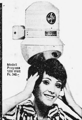
Modell Progress 1200 Watt Fr. 340.—

Baege-Händetrockner gehören in jeden fortschrittlichen Betrieb: Cafés, Restaurants, Hotels, Büros, Fabriken, Spitäler, Sanatorien, Warenhäuser, Kinos, Theater, Tankstellen usw.