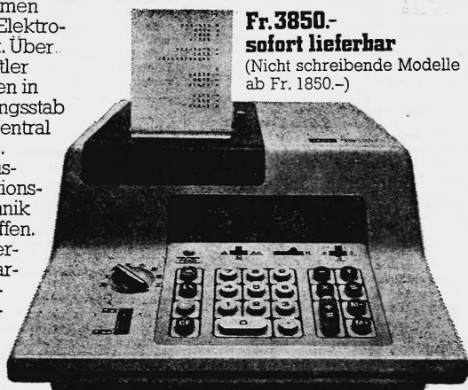
Fr. 3850.- sofort lieferbar (Nicht schreibende Modelle ab Fr. 1850.-)

Seit der Gründung ihrer ersten Fabrik im Jahre 1875 ist Toshiba mit der Entwicklung der Elektrizität und Elektronik eng verbunden. Heute zählt Toshiba zu den grössten Weltunternehmen auf den Gebieten der Elektrotechnik und Elektronik. Über 1200 Naturwissenschaftler und Ingenieure arbeiten in dem grössten Forschungsstab Japans, den Toshiba Central Research Laboratories. Dort werden die Voraussetzungen und Produktionsmethoden für die Technik des Jahres 2000 geschaffen. In ihren 25 Fabriken wirklichen 132.000 Mitarbeiter diese fortschrittlichen Ideen und Erfindungen. Besonders die Entwicklung von modernen elektronischen Tischrechnern ist das Ergebnis praktischer Anwendung neuer Methoden. Diese elektronischen Tischrechner von Toshiba sind leicht, aber unglaublich zäh; klein, aber atemberaubend schnell.