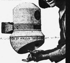
Modell Progress 2000 Watt Fr. 440.- mit Fusschalter