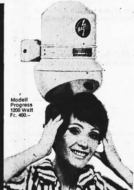
Modell Progress 1200 Watt Fr. 400.-

Baege-Händetrockner gehören in jeden fortschrittlichen Betrieb: Cafés, Restaurants, Hotels, Büros, Fabriken, Spitäler, Sanatorien, Warenhäuser, Kinos, Theater, Tankstellen usw. Baege-Haartrockner , beliebt und bewährt in Sportstätten, Bädern, Schwimmhallen, Douchen-Anlagen usw.