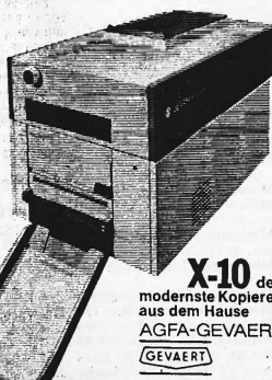
X-10 der modernste Kopierer aus dem Hause AGFA-GEVAERT

Unser Sparangebot beim Kauf eines neuen X-10 20000 Kopien GRATIS!