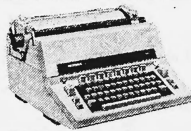
Hermes Ambassador. Die robuste Allround-Schreibmaschine mit dem einzigartigen Leistungs-/Preisverhältnis.