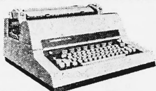
Hermes 700 EL. Die perfekte elektrische Schreibmaschine für die Sekretärin. Jetzt noch perfekter, mit eingebauter Korrekturtaste.

Ein sehr guter Grund mehr, eine der vielseitigen, komfortablen und vor allem unerhört robusten und dauerhaften Hermes-Schreibmaschinen anzuschaffen. Schweizer-Qualität ist wieder Trumpf. Wollen Sie mehr wissen? Schicken Sie uns den Coupon.