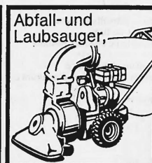
Abfall- und Laubsauger,