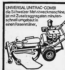
UNIVERSAL UNITRAC-COMBI die Schweizer Mehrzweckmaschine, ist mit Zusatzaggregaten minutenschnell umgebaut in einen Rasenmäher,