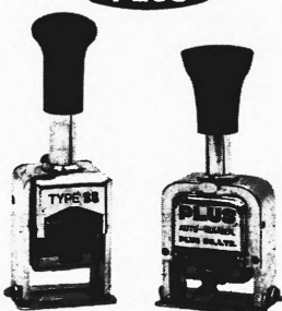
12345 Mod. A-0001/85tg. 123456 Mod. A-0010/85tg.

Numerateure mit automatischer Fortschaltung, bewährt, einfach in der Bedienung, preisgünstig. Prüfen Sie unser Angebot.