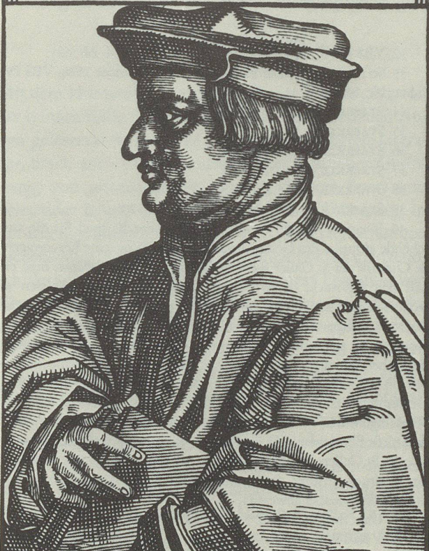
BERCHTHOLDVS HALLERVS Theologus.

Me docet Agrippina Colonia: Berna docentem Audijt hinc veri calica verba Dei.