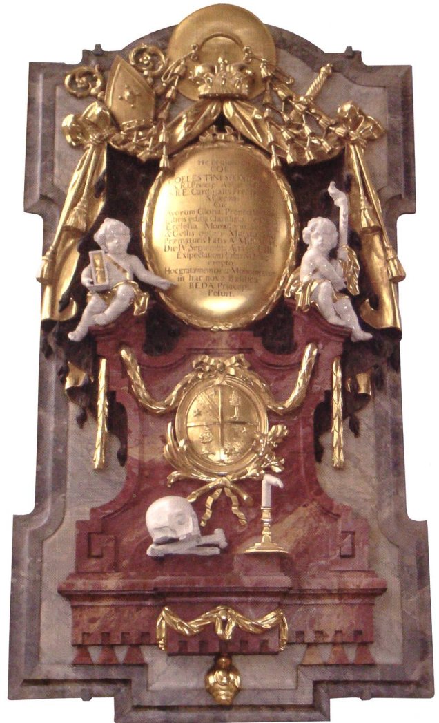
Epitaph (Gedenktafel) für den Verstorbenen an einem Pfeiler im Chor der Kathedrale in St.Gallen mit dem persönlichen Wappen und Symbolen der Vergänglichkeit. P. Hermann Schenk brachte das Herz des Kirchenfürsten nach St.Gallen, und es wurde hier beige-setzt. Die Inschrift lautet: «Hier ruht das Herz des Fürstabtes Coelestin Sfondrati, Kardinalpriester von Sta. Cecilia. Angesehen durch den Ruhm der Ahnen, persönliche Tugend und Veröffentlichungen, für Gott, die Kirche und das Kloster in Schrift und Tat hoch verdient, aber vorzeitig der Erwartung von Rom und der Welt entrisen, im Alter von 53 Jahren. Dieses Denkmal setzte in dankbarer Erinnerung in dieser neuen Kirche Fürstbist Beda (Angehrn)».

erklären. Eindeutige Risikofaktoren – und damit Möglichkeiten zur Verhütung – gibt es bei diesem Tumor nicht, abgesehen von seltenen hereditären Formen. Empfohlen werden eine vermehrte Zufuhr pflanzlicher Produkte (Salat, Gemüse, Früchte) und regelmässige körperliche Aktivität. Dickdarmkarzinome sind die dritthäufigsten Malignome des Mannes und werden auch heute oft bei 50-Jährigen entdeckt, können aber – im Gegensatz zu Sfondratis Zeit – in vielen Fällen geheilt werden, besonders in ihren Frühstadien.