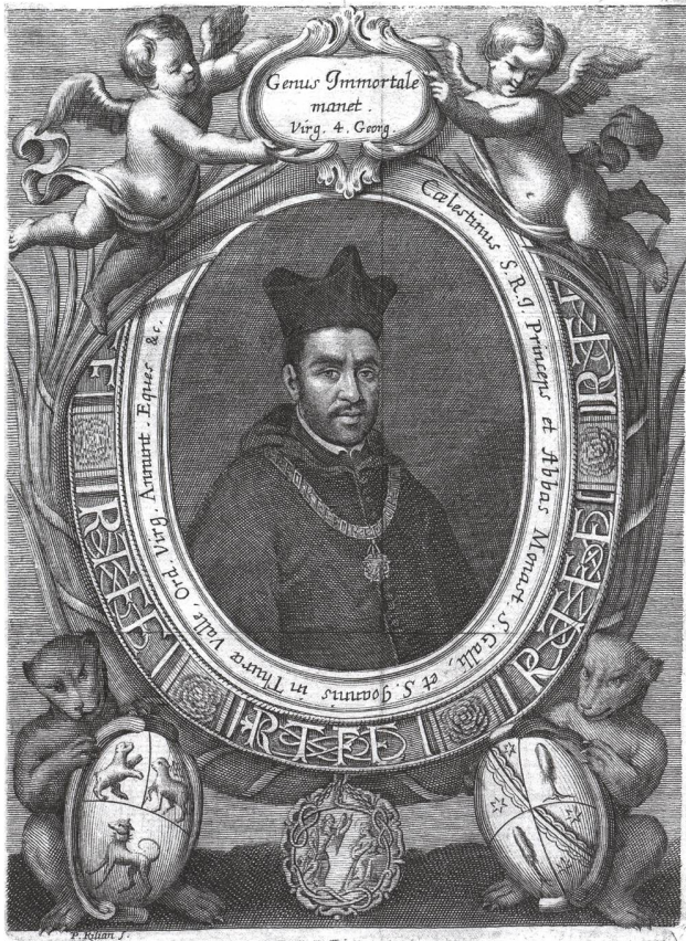
Porträt von Coelestin Sfondrati als Fürstabt der Klöster St. Gallen und St. Johann im Thurtal. Kupferstich von P. Kilian, nach 1687 (Stiftsbibliothek St. Gallen).