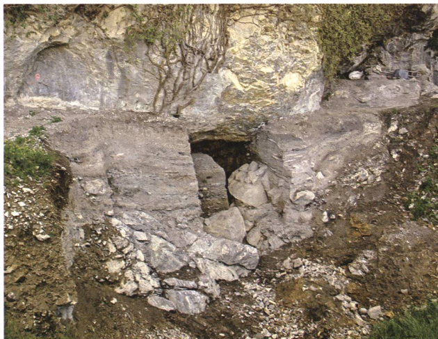
Oberriet, Unterkoebel. Nach Abschluss der Grabungen im Juni 2012.

bio Wegmüller). Dadurch konnte ein repräsentativer Ausschnitt der 2011 von Spallo Kolb entdeckten Fundstelle ausgegraben und offene Fragen zur Ausdehnung der Fundschichten geklärt werden. Nach Abschluss der Aus-