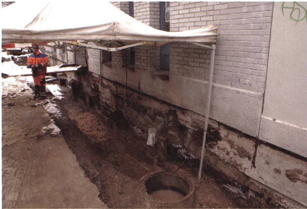
St. Gallen, Zeughausgasse, vor Haus 7. Missliche Bedingungen für die Dokumentation eines frühmittelalterlichen Grabes durch Roman Meyer.

stadt nachweisbar ist, auf Höhe des Restaurants Zeughaus endet. Von dort nach Osten erstreckt sich ein ausgedehnter Friedhof, dessen südliche Ausdehnung bereits 1998 beim Bau des Pfalzcellers erfasst worden ist. Fünf Gräber wurden aufgedeckt, auf rund 20 m wurden gefleckte Auffüllungen von zahlreichen weiteren Gräbern beobachtet. Um Kosten und Zeit zu sparen, wurde nach der Entdeckung der ersten Gräber die Sohle der Gräben oberhalb der zu erwartenden Bestattungsschichten gehalten. Damit bleibt der Friedhof im Boden bewahrt. Seine nördliche Ausdehnung kann nun abgeschätzt werden. Er reicht bis zu einer quer zur heutigen Strasse laufenden, mindestens 2.4 m tiefen Senke auf Höhe der Häuser 11 und 12. Diese Senke könnte als künstlicher Ostabschluss der frühmittelalterlichen Klostersiedlung gedeutet werden. Ein Graben als Abschluss der Klostersiedlung liess sich auch in der Webergasse feststellen. Auch hier wurde er spätestens ab dem 13. Jahrhundert aufgelassen und aufgefüllt.