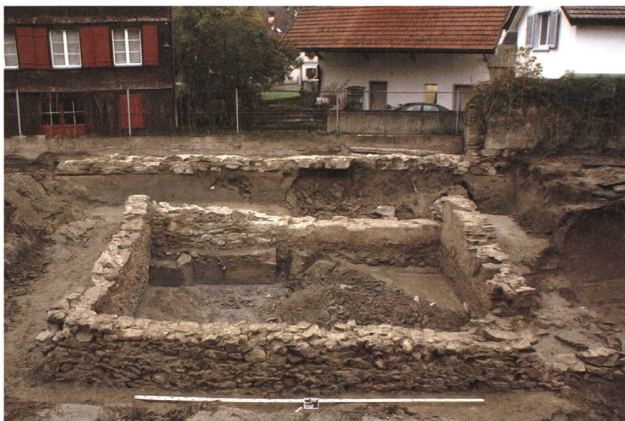
Rheineck, Im Weier. Übersicht über das freigelegte Gebäude und die Stadtmauer.

Das Areal liegt im Nordwesten des mittelalterlichen Städtchens. Ein Überbauungsprojekt bedingte Sondierungen (Leitung Steffen Knöpke). Dabei konnte der bo-