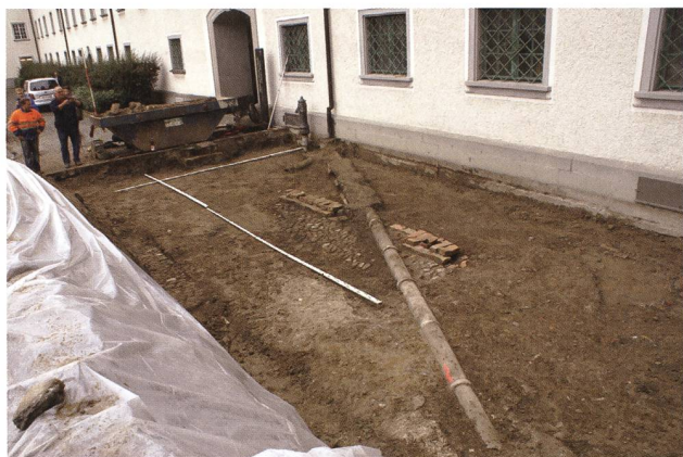
St.Gallen, Klosterhof. Direkt unter dem Humus erscheinen Wasserkanäle des 19. Jahrhunderts und die barocke Hopfpflasterung.

Im Keller des Bischofsflügels ist seit 2008 das Büchermagazin der Stiftsbibliothek untergebracht. Da die Feuchtigkeit zum Dauerproblem wurde, war das Mauerwerk trocken zu legen. Eine Sickerpackung entlang des Klosterflügels bis unter das Fundament hätte eine Grossgrabung mit hohen Kosten zur Folge gehabt. Deshalb war eine Lösung mit möglichst geringen Bodeneingriffen gefordert, was auch den knappen Finanzen des Katholischen Konfessionsteils entgegen kam. Eine Kunststoffabdeckung mit Abflussrinne soll nun das Oberflächenwasser vom Gebäude ableiten. Dieses Vorgehen ermöglichte, bedeutendes archäologisches Kulturgut im Unesco-Weltkulturerbe