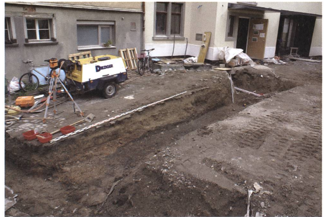
St. Gallen, St. Katharinen. Blick auf den neuen, in archäologische Schichten eingetieften Fundamentgraben. Gut sichtbar der mittelalterliche rötliche Brand- und Abbruchschutt.

sprachen verzögerte sich das Bauprojekt bis 2012. Die Kantonsarchäologie wurde erst kurz vor Baubeginn informiert, obwohl die 2008 erteilte Baubewilligung bereits auf die notwendige archäologische Untersuchung hingewiesen hatte. Die Ausgrabung, die vom 23. Juli bis 28. September dauerte, leitete Dr. Steffen Knöpke.