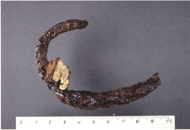
Rorschach, Raiffeisenbank, Grab 2. Eiserner Armreif des 7. Jahrhunderts mit anhaftendem Knochenfragment der rechten Elle.

machungszahlung und mehreren Strafbefehlen. In der Folge konnten diverse Baggerarbeiten auf kleineren Restflächen durch Dr. Regula Steinhauser archäologisch begleitet werden. Dies führte zur Entdeckung eines weiteren geosteten Grabes (Grab 2). Der 40–50 Jahre alte, knapp 169 cm grosse Mann trug am rechten Vorderarm einen eisernen Armreif mit verdicktem Mittelstück, der in die erste Hälfte des 7. Jahrhunderts datiert. Die frühmittelalterliche Zeitstellung der beiden Gräber wird durch C14-Daten am Skelettmaterial bestätigt (Grab 1: 8/9. Jh., Grab 2: 6./7. Jh.). Sie gehören demnach zu dem schon seit 1869 bekannten frühmittelalterlichen Friedhof rund um die im 7./8. Jahrhundert errichtete Kolumbanskirche. Bei den unbegleiteten Aushubarbeiten dürften mehrere frühmittelalterliche Gräber zerstört worden sein.