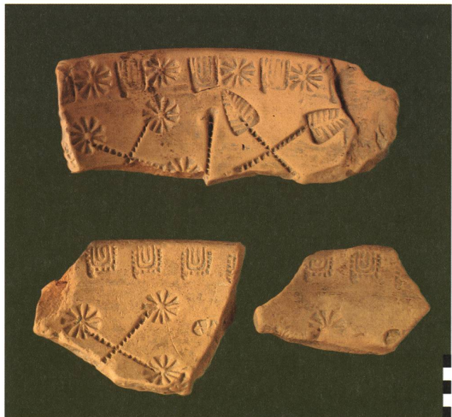
Rapperswil-Jona, Kempraten, Nuxo. Fragmente von zwei Formschüsseln zur Herstellung von Reliefsigillata. Passende Ausformungen sind noch nicht bekannt.

In der Südecke der Bauparzelle wurden im Profil der Baugrube mehrere Gruben angeschnitten. Eine davon dürfte als Töpferofen zu interpretieren sein. Im zentralen Bereich (Grabung 120 m 2 ; Leitung Pirmin Koch) fand sich ein dreiphasiger Graben, der von Osten nach Nordwesten Richtung Vicus bog. Der älteste Graben war nur schlecht erhalten, da er von den jüngeren geschnitten wurde. Der