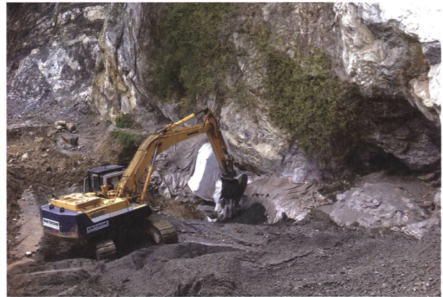
Oberriet, Unterkoebel. Zuschütten der Fundstelle.

grabung wurden die Fundschichten mit Geotextil abgedeckt und zugeschüttet.