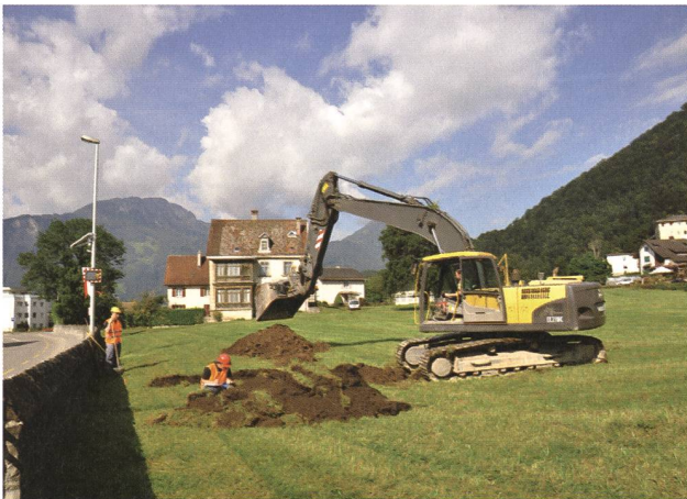
Weesen, Staad. Baggersondagen im August, Blick gegen Westen.

Die wenig überbaute Flur «Staad» liegt im Nordosten des Städtchens Alt-Weesen auf dem Schuttkegel des Spittelbachs. Eine geplante Überbauung machte archäologische Sondierungen nötig. Die Arbeiten wurden durch ProSpect GmbH als Mandat durchgeführt. Ganz im Süden des Areals liegen Reste der mittelalterlichen, 1388 zerstörten Stadt Alt-Weesen und der 3,5 m tiefe Stadtgraben, der noch bis ins 20. Jahrhundert sichtbar war. Vom nördlichen Bereich gab es dagegen keinerlei archäologische Informationen. Hier wurden in der Folge 16 Suchschnitte geöffnet. Diese wurden in den mächtigen Überdeckungen des Spittelbachs bis zu 3,5 m tief ausgehoben. Bis auf ein undatiertes Mauerfundament wurden im nördlichen Bereich keine archäologischen Strukturen gefasst. Eingela-