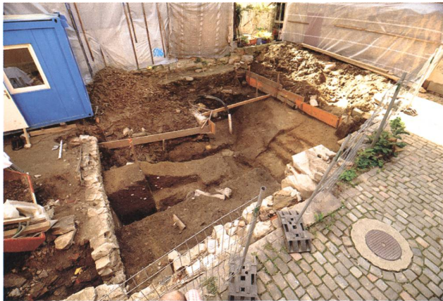
St. Gallen, Schwertgasse 15. Blick auf den ehemaligen Hinterhofbereich und den teilweise ausgenommenen Graben.