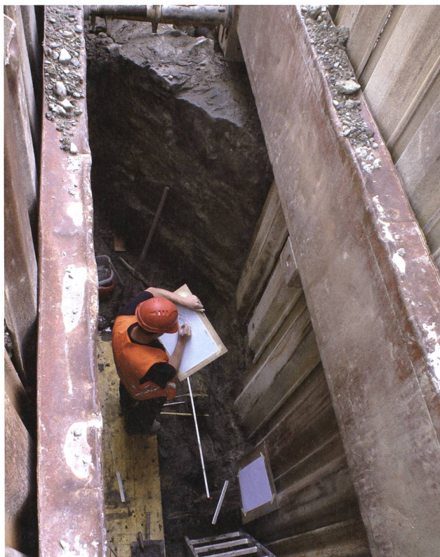
St.Gallen, Schwertgasse, vor Haus Nr. 27. Blick auf die gut erhaltene Stadtmauer und den davor liegenden Stadtgraben. Erwin Rigert beim Dokumentieren.

Die erste Etappe zur Erneuerung der Werkleitungen in der nördlichen Altstadt startete in der Schwertgasse. Erstmals erfolgte eine systematische archäologische Begleitung (Leitung Erwin Rigert). Dabei konnte der Verlauf der im 15. Jahrhundert errichteten und 1809 niederge-