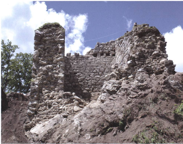
Wildhaus-Alt St.Johann, Wildenburg. Hauptturm nach der Freilegung.

haltungszustandes musste auf der Westseite eine grosse Partie des Mauermantels neu aufgeführt werden. Am Turm wurden die Konservierungsarbeiten abgeschlossen, die restlichen Arbeiten sind für das Frühjahr 2013 vorgesehen.