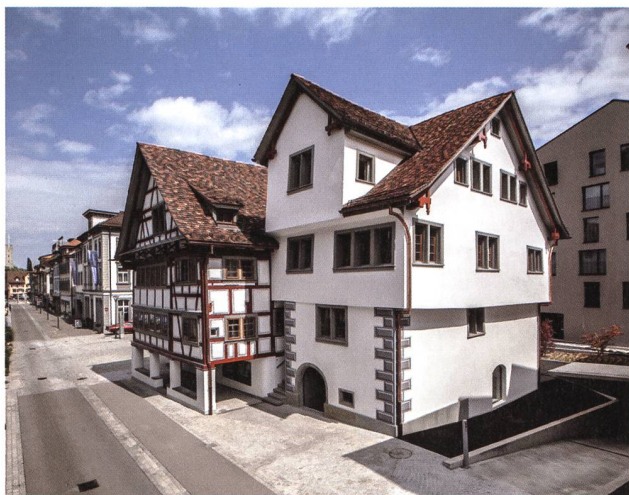
Rheineck, Krone und Laterne nach Jahren der Verlotterung frisch renoviert. Foto architekten : rlc ag, Rheineck.

mern, Planenden, Handwerksleuten und Restaurierungsfachleuten vermerken. Es sind Beispiele, die Mut machen, anregend und – hoffentlich – auch ansteckend wirken. Ganz besonders erfreulich ist der gelungene Abschluss der Renovations- und Erneuerungsarbeiten im Kronenareal Rheineck, gerade weil diese Aufgabe anfänglich so schwerfällig anlief, weil die Hürden zeitweise unüberwindbar schienen und weil die Bauten als hoffnungslos baufällig bezeichnet wurden. Auch die Krone wurde für einen «Schandfleck» gehalten – aus ihr ist ein Vorzeigebau geworden.