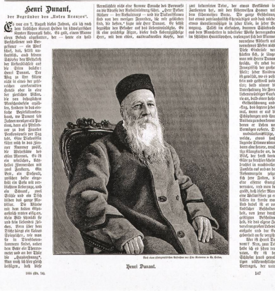
Henri Dunant, der Begründer des «Roten Kreuzes» In: Über Land und Meer. 74. Band (37. Jg.), Heft Nr. 49. 6. September 1895. S. 897f.