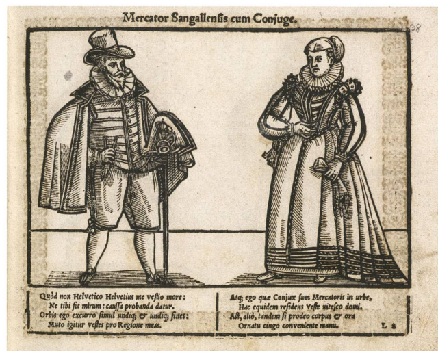
Kleider machen Leute, wie dies der St. Galler Georg Straub in seinem Trachtenbuch zeigt. Aus: Icones, Quibus Habitus Omnium Fere Mundi Gentium: Tum Virili, Tum Muliebri Sexui Cuiusvis Conditionis, pro More Convenientes, Et Hactenus Usitati: Suis Imaginibus Ad Vivum Exprimuntur. Nunc primum in lucem editae. Per Georgium Straubium Typographum Sangallensem, 1600. VadSlg Inc 960, S. 38.

Schau gestellten Luxus oder die Sittlichkeit verletzende Bekleidung zu verbieten. Kein Mandat, so scheint es, verzichtete auf einen Absatz, der die Bekleidung regelte. 19 Stellten die zerhauenen, also geschlitzten, Hosen «überfluss» und «hoffart» dar, so ist auf den ersten Blick nicht klar, was mit unchristlicher Kleidung gemeint ist. Man solle sich «teckhen, sin rock zusammen thuon» und die «ersahmmen leüthen» nicht damit «tratzen», also herausfordern. Verständlicher wird diese Passage, wenn man den Kommentar über die «gemainen dochteren an mißbruch» in Johannes Kesslers Sabbata gegenüberstellt. Dort beklagt sich der Autor, dass «sy ire herze vorne und hinden biß auf die brust (...) entblosstend». Diese sogenannte «entdeckung der herzen und hälsen» wird von Kessler auch als «die tafel ufthun» bezeichnet. Damit spielt er darauf an, dass bei hohen katholischen Feiertagen die üblicherweise geschlossenen Altartafeln geöffnet wurden und damit ihr Innerstes preisgaben. Entsprechend machten dies auch die jungen Frauen, damit «man die abgöttli zuo anrainzung böser, unjunkfröwlichen begirden sechen möchte.» 20 Ob dies eher ein städtisches Problem war oder auch in den vier Höfen für Unruhe sorgte, muss offenbleiben. Auffällig ist aber, dass im Gegensatz zu anderen zeitgenössischen Kleiderordnungen dieser Passus wenig detailliert ist und auch keine Strafandrohung enthält. Zudem wird eine erstaunlich lange Frist von einem halben Jahr gewährt, die unziemlichen Kleider abzuändern.