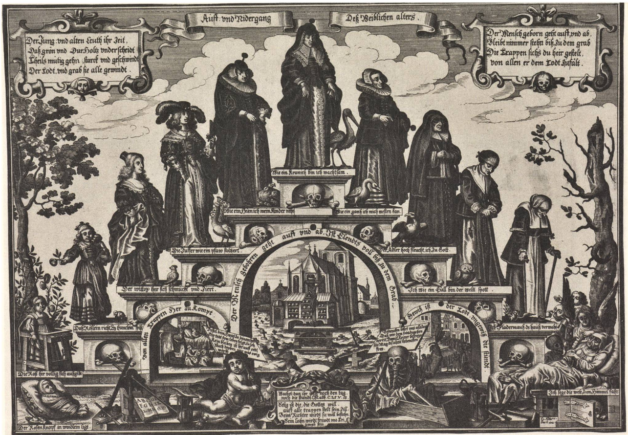
Auff und Nidergang deß Weiblichen alters. Kupferstich von Abraham Aubry, verlegt von Gerhard Altzenbach, Köln um 1640. Status wird als Stufe auf der Lebenstreppe dargestellt. Dabei werden die Eigenschaften jeder Altersstufe durch geflügelte Attribute (Vögel, Fledermaus) angedeutet. Die Antithetik von Wachsen und Vergehen, von Jugend und Alter, welche die linke und rechte Seite der Stufenpyramide bestimmen, wird durch weitere Bildmotive wie Bäume oder Memento Mori ergänzt. Die Periodisierung des Lebens in zehn Stufen, mit sieben Jahren pro Stufe, geht auf die Antike zurück. Hier sind es 13 Stufen. Aus: Harms/Schilling. Deutsche illustrierte Flugblätter Berlin 2018. Bd. IX. S. 80. Kantonsbibliothek Vadana VBF 8.

lichen und notwendig zu machen. Er ist aber auch deutlich genug, um nicht jede individuelle oder kollektive Abgrenzung als Statushandlung zu verstehen. Status bietet, sozial verstanden, ein Instrument, die eigene Umgebung einzuteilen und dadurch beherrschbar zu machen. Gleichzeitig bietet Status aber auch ein normativ-ethisches Modell an, «wie das Viele und Verschiedene, was ist, in seiner Vielheit zusammengefügt ist zu einem Ganzen». 7 Ordo, Conditio oder Status sind auf eine ideelle, gottgegebene Ordnung ausgerichtet, die sich, sofern sie nicht gestört wird, durch Friedlichkeit, Harmonie und Gerechtigkeit auszeichnet. Faktisch bestehende soziale Ungleichheiten werden deshalb kaum in Frage gestellt, sondern religiös überhöht und dadurch zementiert. Anerkennt man die Vorstellung einer allgemeinen Ordnung erst einmal an, ist es nur noch ein kleiner Schritt, selbst in diese Ordnung einzugreifen. Ins-