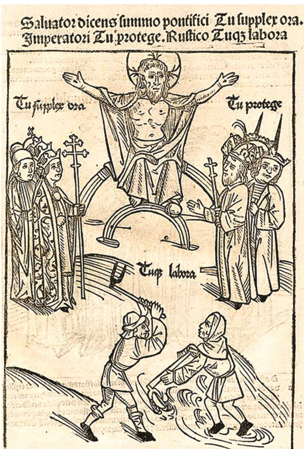
Darstellung der spätmittelalterlichen Ständeordnung. Holzschnitt von Jacob Meydenbach aus der Prognosticatio von Johannes Lichtenberger, 1488. Christus auf dem Regenbogen segnet die drei Stände Klerus (links), Adel (rechts) und Bauern (unten). Die Aufschrift «Tu supplex ora, tu protege, tuque labora» bedeutet «du bete demütig, du schütze, und du arbeite.»

Der Vielzahl der Begrifflichkeiten entspricht die Vielfalt der Möglichkeiten, mit denen sich die Gesellschaften der Vergangenheit selbst differenzierten und ordneten. Mit Status konnten entweder Kriterien wie Abstammung (Geburtsstand), abgestufte Teilhabe an der politischen Herrschaft (Lehenstand, später Bürgerstand) oder die Funktion innerhalb der Gesellschaft (Berufsstand) voneinander un-