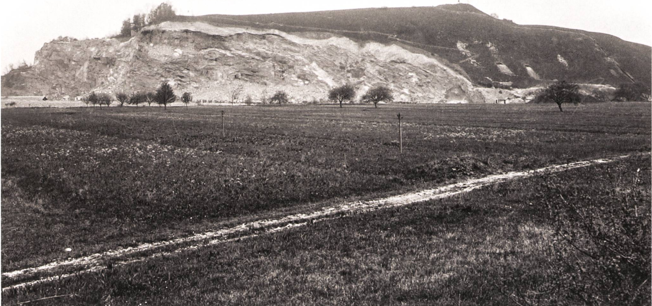
Steinbruch der Internationalen Rheinregulierung, 3. Mai 1913, von Nordwesten. Vor der Sprengung wurde an der oberen Kante die Erde entfernt; dabei kamen unter anderem auch die Bernsteinperlen und -knöpfe zum Vorschein. Der Abschlusswall im Westen des Hochplateaus ist deutlich sichtbar. StASG A 481/03.01-02.

mittelbar daneben stehenden Häuser. Feuerstellen, Hausgrundrisse und Funde belegen aber, dass die Siedlung weiterhin bestand und während des ganzen 1. vorchristlichen Jahrtausends mehrfach um- und neugebaut wurde. Funde von römischer Keramik und sorgfältig gelegte Fundamente eines Gebäudes zeigen, dass der Berg auch im 1. nachchristlichen Jahrhundert besiedelt war. 1