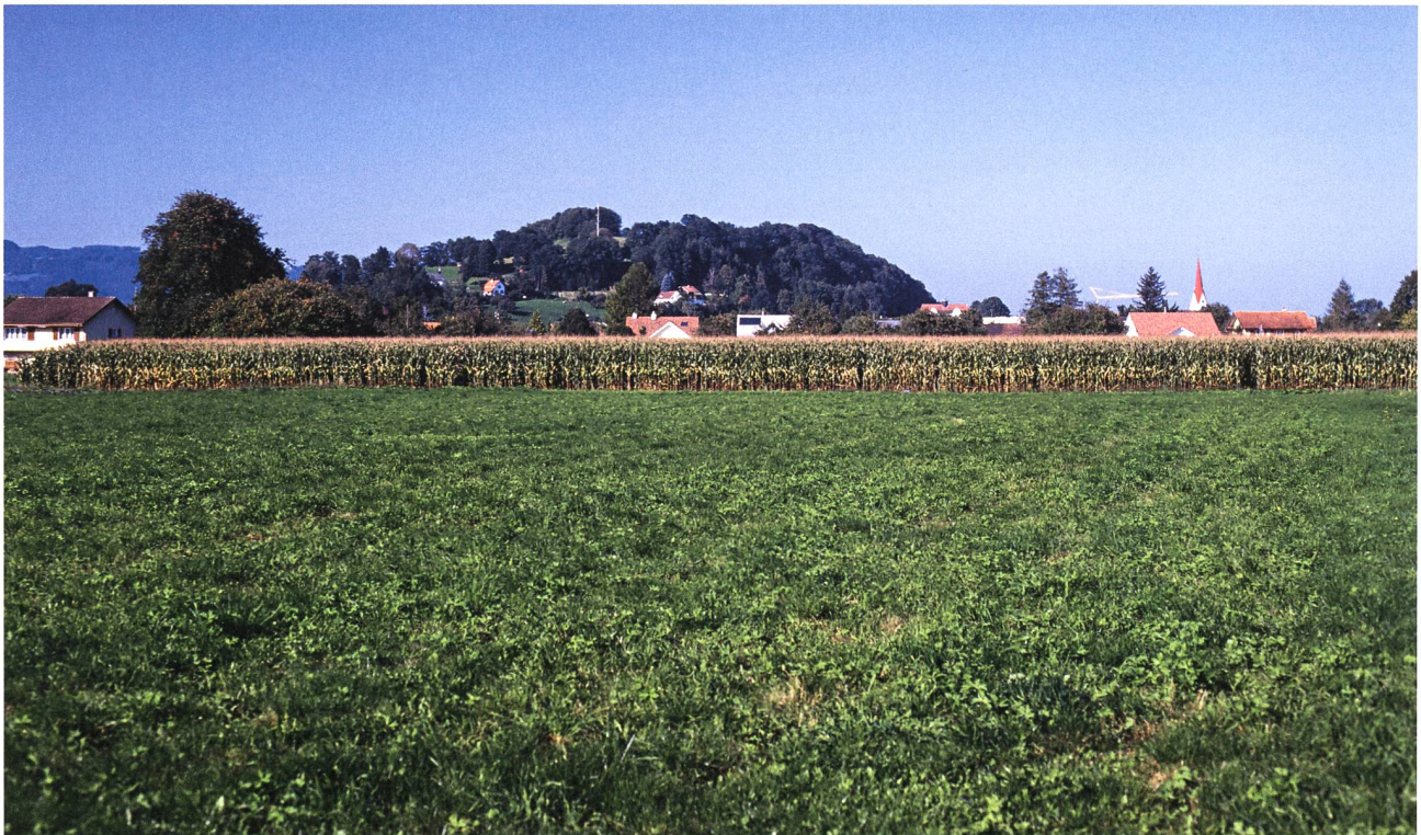
Der Montlingerberg im Rheintal. Ansicht von Süden.

Die 1989 publizierte Gesamtauswertung von Funden und Grabungen ergab, dass der Montlingerberg bereits während der späten Jungsteinzeit und der Mittelbronzezeit von Menschen begangen worden war. Während der späten Bronzezeit, etwa in der Mitte des 11. Jahrhunderts v. Chr., begann eine rege Siedlungstätigkeit. Quer über das Plateau errichtete man einen Wall aus Trockenmauern und mit Lehm gefüllten Holzkästen. In seinem Schutz lag die Siedlung. Der Wall stürzte allerdings schon nach wenigen Jahrzehnten zusammen und beschädigte oder zerstörte die un-