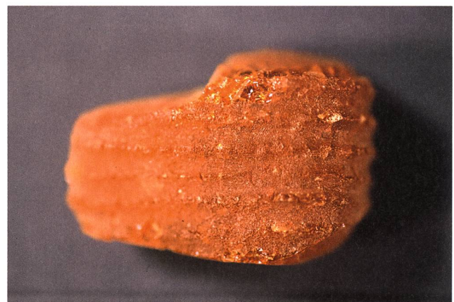
Zerbrochene Bernsteinperle. Aussenseite mit Rillen, braunrot verfärbt; Innenseite links alt gebrochen, rechts mit neuem Bruch. Im Bruch sind die braunrote Oxidationsschicht und die originale honiggelbe Farbe sichtbar. Die Längsdurchbohrung der Perle zeichnet sich deutlich ab.