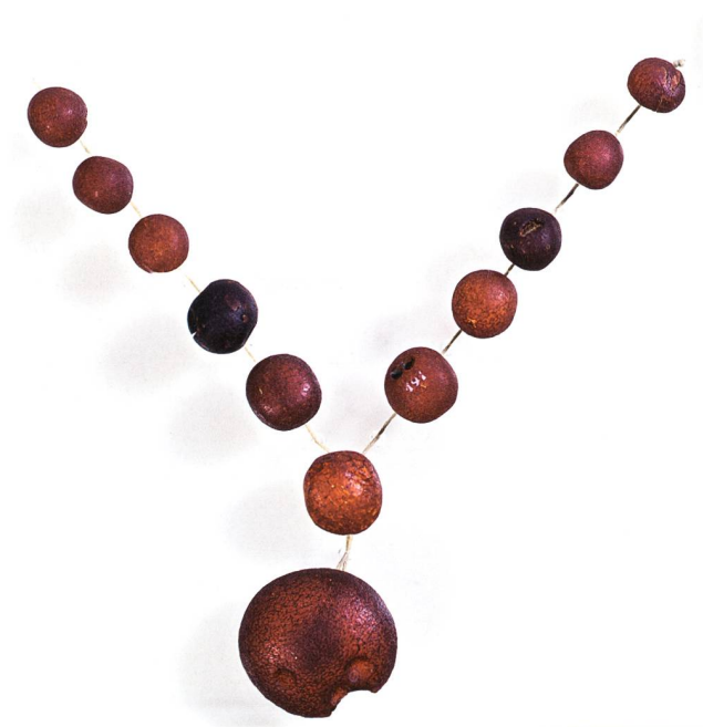
Bernsteinperlen und -knöpfe vom Montlingerberg.