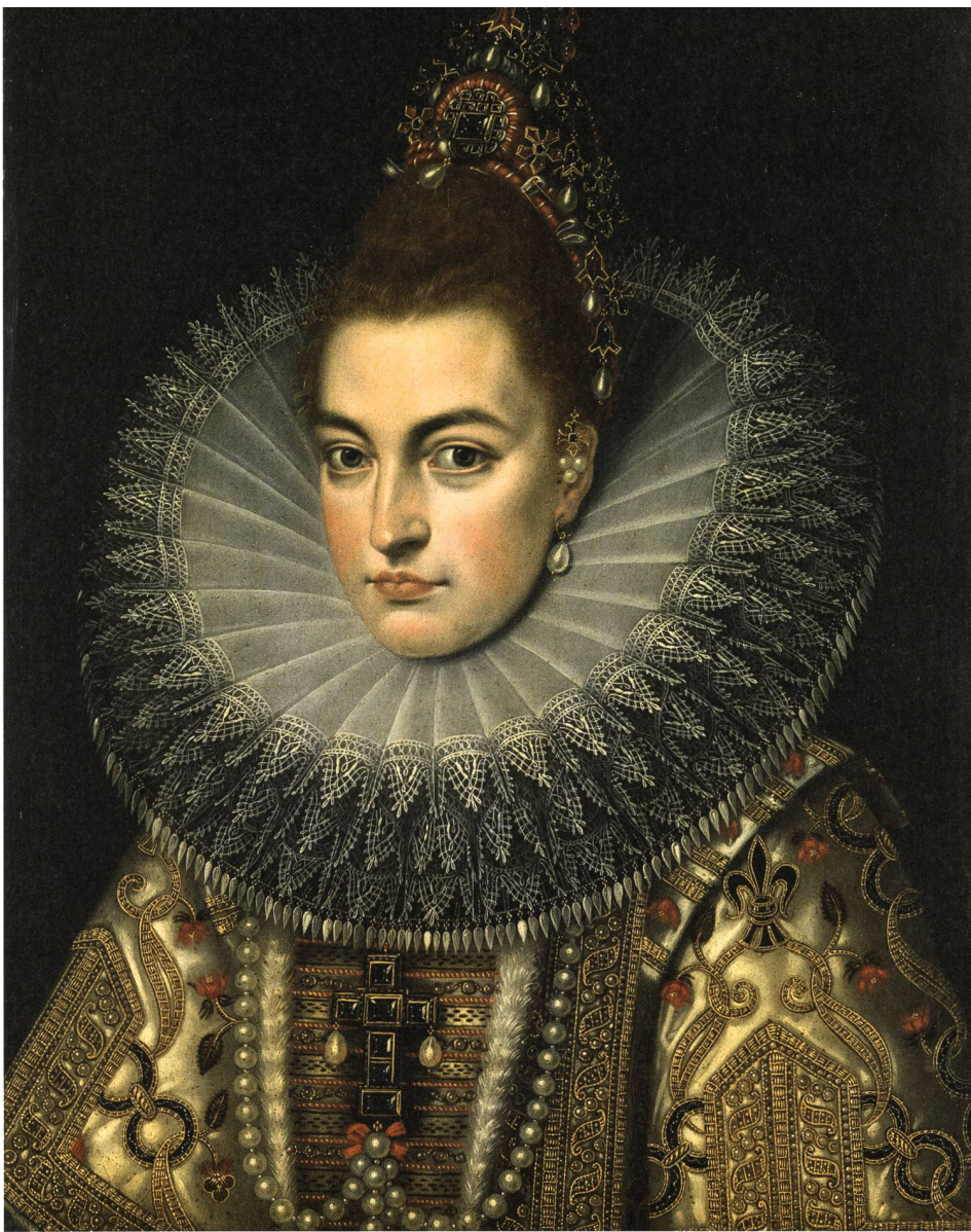
Portrait der Erzherzogin Isabella Clara Eugenia, Frans Pourbus (II) (Werkstatt), um 1600, Rijksmuseum Amsterdam, Inv. SK-A-510.

zentrierte sich jedoch vorwiegend auf die Herstellung von Stickereien.