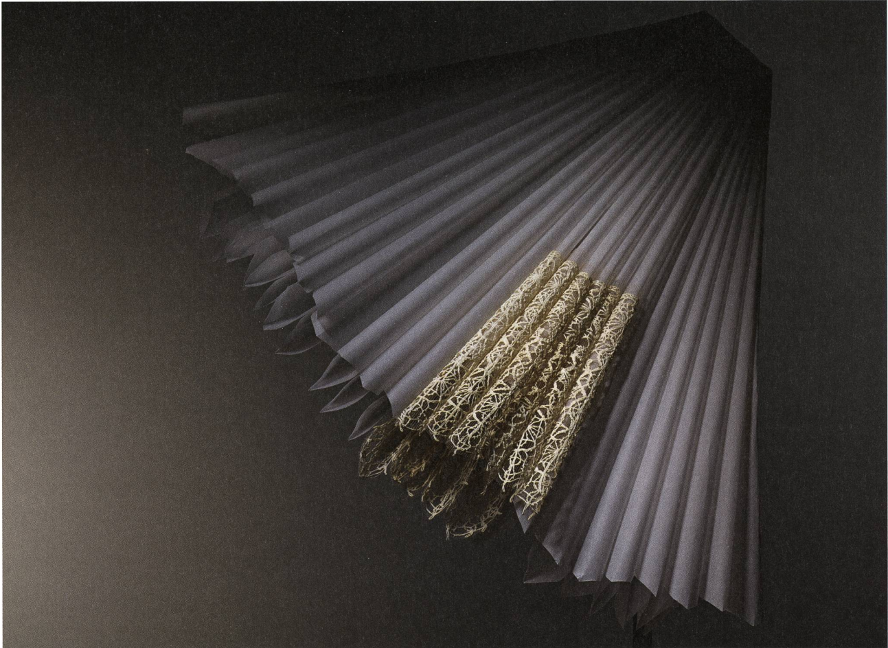
Borte zu Kragen montiert, Leinen, Klöpplspitze, Nordwesteuropa 1580–1620, Textilmuseum St. Gallen Inv. 00679.

Die Dame schreibt darin, dass die Kunst der Spitzenproduktion gegen 1530, aus Italien kommend, in der Schweiz Verbreitung fand. 8 Die damals noch relativ neue Technik des Buchdrucks verbreitete die Muster in Form von Modelbüchern, aber auch botanischen Werken, die häufig blumenreich illustriert waren, in ganz Europa. 9 Das Phänomen der Modelbücher reiht sich in das weitere europäische Bestreben des 16. Jahrhunderts ein, Dingen ihre Ordnung zu geben. Ein weiteres Beispiel dafür mögen sowohl biologische und zoologische Publikationen aus der Zeit sein, aber auch die Gründung von Kunst- und Wunderkammern in Adels- und Gelehrtenzirkeln.