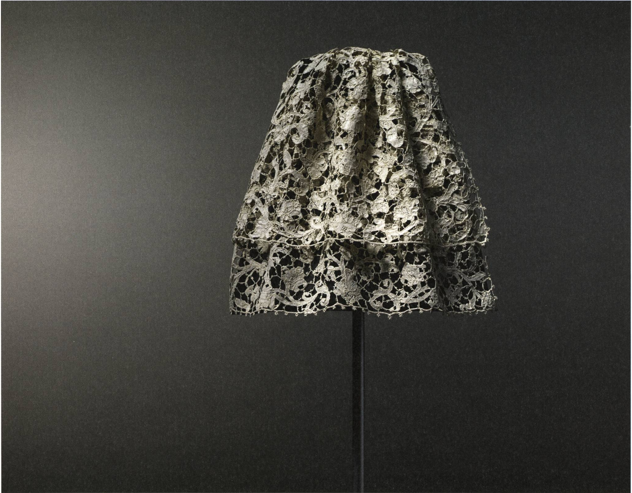
Krawatte (oder Manschetten), Leinen, Nadelspitze, Venedig, um 1690 (Ende 19. Jh. ergänzt), Textilmuseum St. Gallen Inv. 01226. 1-2.

Louis XIV. Wie oft im Fall von erfolgreichen Produkten, wurden diese Spitzen im venezianischen Stil bald in anderen Herstellungszentren, vor allem in Frankreich, nachgemacht, sodass es heute schwierig ist, diese und andere Spitzen eindeutig einem Ort zuzuordnen.