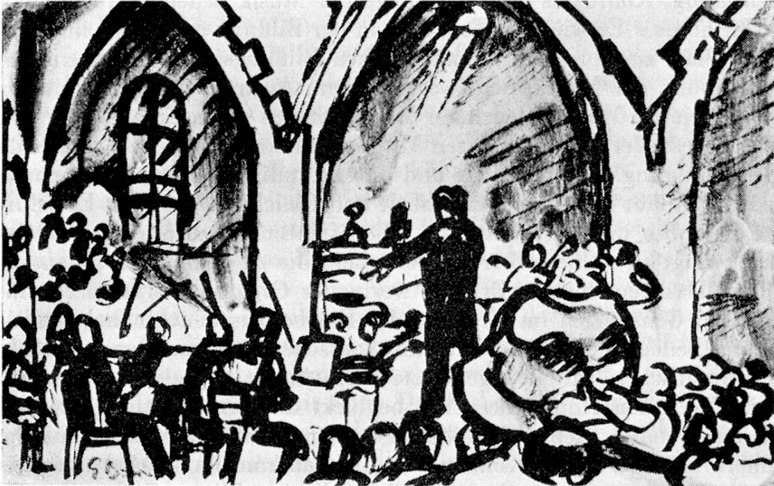
Konzert in der französischen Kirche zu Bern