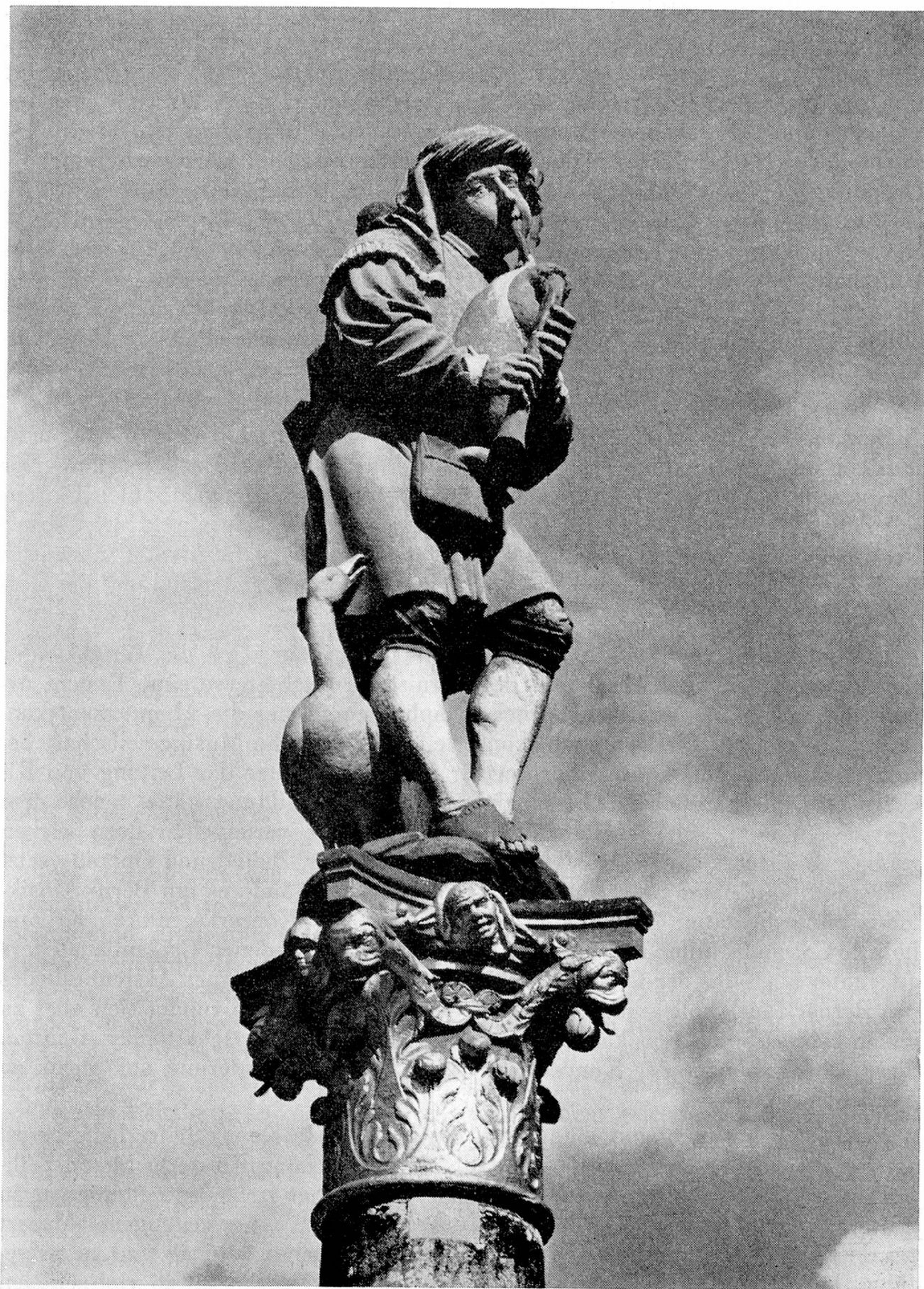
Der Dudelsackpfeiferbrunnen in Bern — La fontaine du cornemuseur à Berne