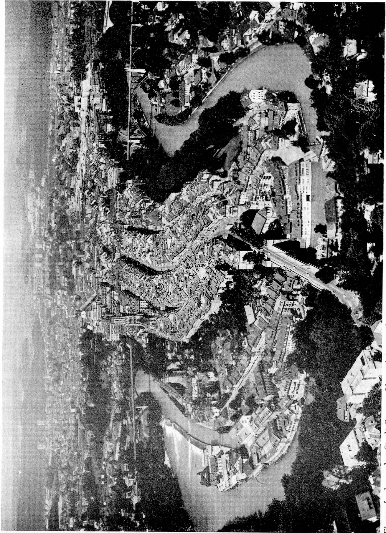
Flugaufnahme der Stadt Bern — Vue aérienne de la ville de Berne