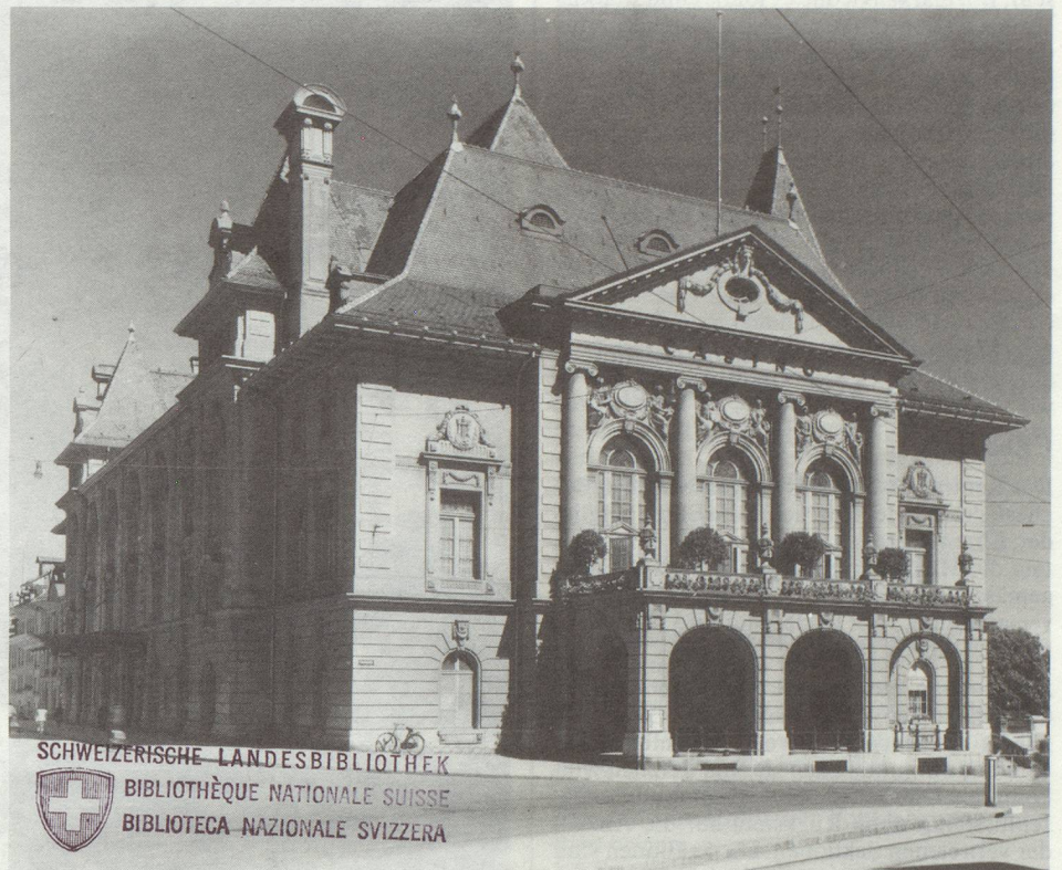
Das Casino in Bern – Le Casino de Berne

Das Berner Konzertorchester freut sich ausserordentlich, den Zentralvorstand, die Musikkommission, die Ehrenmitglieder und die Delegierten der Sektionen des Eidgenössischen Orchesterverbandes am 14./15. Mai 1983 in Bern zur 63. Delegiertenversammlung willkommen zu heissen.