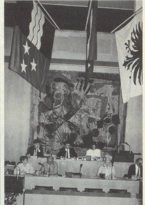
Im Grossratssaal Aarau

Es sind nur die Rechnungsrevisoren neu zu bestimmen: Die Orchestergesellschaft Luzern scheidet – mit dem Dank für die geleisteten Dienste – aus.