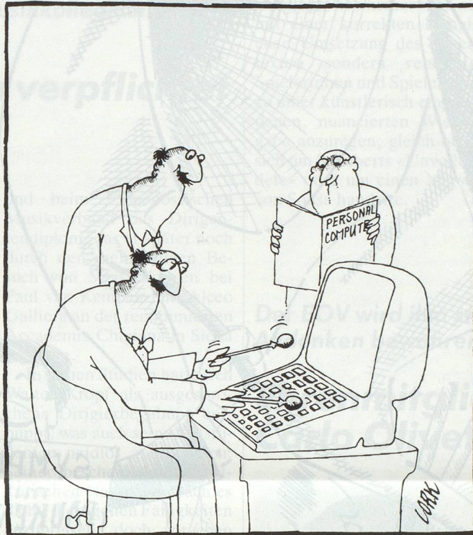
Musik in die Bibliothek – bzw. einen Computer für die Orchester. Un ordinateur au service des orchestres.

Die Initianten sind überzeugt, dass Proscript einem Bedürfnis entspricht. Es liegt nun an der Verwaltung und den Mitarbeitern, Proscript bekannt zu machen und gute Arbeit zu leisten.