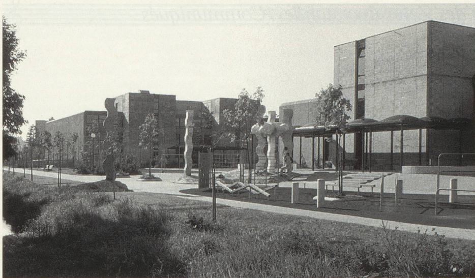
Die Tagung «Jugend- und Schulorchester in der Schweiz» ist im Bildungszentrum Zofingen angesagt. La conférence-débat concernant les orchestres de jeunes se tiendra au Centre culturel de Zofingue.