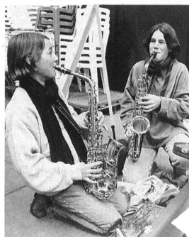
Junge Instrumentalisten – Orchestermitglieder und Konzertbesucher der Zukunft. Jeunes instrumentalistes: membres des orchestres et publique dans les concerts de demain.

L'un des concerts a eu lieu dans les salles d'un musée d'art, où les cuivres ont été priés de ne pas «forcer» pour éviter les dégâts. Les participants ont par ailleurs eu l'occasion d'assister à des répétitions au Metropolitan Opera où jouait l'Orchestre philharmonique de New York.