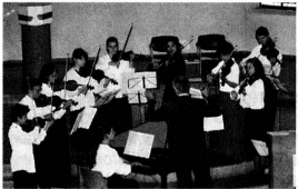
Camerata Giovanile della Svizzera Italiana in Zofingen