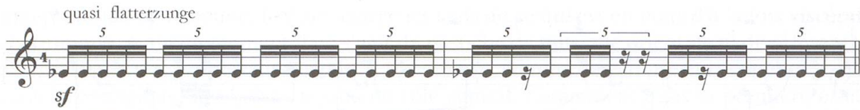
Ex. 5: Jolivet, deuxième Incantation , mes. 1-2.