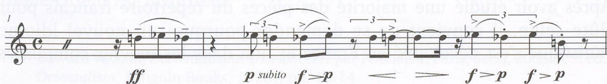
Ex. 9 : Varèse, Density 21.5 , mes. 38-40.

En effet, le motif initial est parfois répété avec la troisième note, par rapport à sa première occurrence, écourtée (mesure 3) ou allongée (mesure 41). Cependant, son rythme n'est souvent qu'un lointain souvenir. Dans ce cas, l'on reconnaît le profil mélodique (par exemple ré 4 – mi 4 – ré bémol 4 aux mesures 38 à 40), mais le rythme est différent (Cf. ex. 9). Il en va de même pour le triton, par exemple, aux mesures 11-12 (Cf. ex. 10).