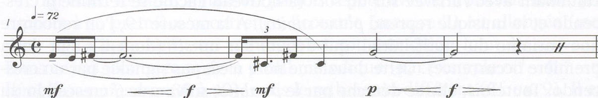
Ex. 8 : Varèse, Density 21.5 , mes. 1-3 (publié avec l'autorisation de la maison d'édition, © Ricordi 1991).

Varèse extrait toute sa pièce de deux cellules de base ( fa^3 - mi^3 - fa dièse 3 , puis do dièse 3 - sol^3 ). La première est formée d'une seconde mineure, suivie par une seconde majeure. Ces deux intervalles, les plus petits possibles (dans un système n'admettant pas les micro-intervalles), ne nous donnent aucun repère quant à une éventuelle orientation tonale. Le second présente un triton. La phrase initiale est donc constituée par une ligne chromatique, si l'on «redresse» les intervalles ( mi^3 - fa^3 - fa dièse 3 ), suivie par un saut ( do dièse 3 - sol^3 ). Toutefois, l'on peut noter que le triton est composé avec le sol^3 , degré suivant du chromatisme. Après la première cellule (mesure 1), on trouve un saut do dièse 3 - fa dièse 3 préparant le triton qui débute p et parvient à un f (mesure 3). Le reste de la pièce sera construit sur une alternance de ces deux motifs (Cf. ex. 8).