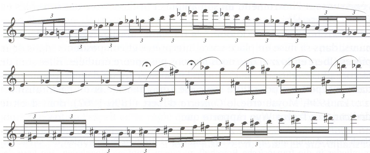
Ex. 11 : cadence de Moyses pour Ibert, Pièce .

élèves de Moyses. 135 La version qui nous est parvenue 136 n'est pas identique à celle écrite par Ibert. Il s'agit d'une variante que Moyses jouait et enseignait (avec, notamment, un point d'orgue ajouté, qui correspond à son interprétation). Elle est un peu plus ornée que celle d'Ibert (Cf. ex. 11).