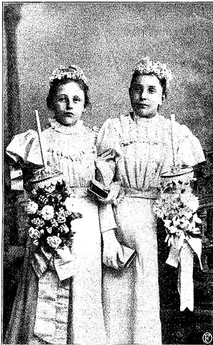
Der schönste Tag des Lebens.

Was konnte heute der Fräulein Lehrerin willkommener sein, als diese Anfrage? Sogleich durchzuckte der Gedanke an die arme Brigitte ihr mitleidiges Herz; ja, wenn sie diese bei Frau Stalben plazieren könnte, dann wäre sie gerettet. Aber was würde die vornehme Frau dazu sagen? Ob sie wohl damit einverstanden sein würde? — Doch was half das Zweifelnd und Bangen? „Frisch gewagt ist halb gewonnen“ — es ging um eine unsterbliche Seele.