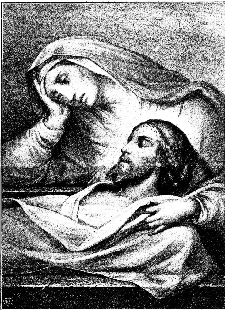
Am hl. Grabe.

Rührend war die Aufopferung des alten Mannes für die Kleine; während er selbst das Notwendigste entbehrte, brachte er ihr Leckerbissen aller Art nach Hause; während sein Besitztum verfiel und sein eigener Rock seiner auffallenden Schübigkeit wegen die Zielscheibe des Spottes seiner Schüler geworden, schmückte er das Kind mit allem erdenklichen Puß. Es gewährte in der That ein seltsames Bild, das elegante, feingegliederte Mädchen mit dem zarten Gesicht in dem mit rohen Möbeln notdürftig ausgestatteten Gemach neben dem alten Musiker stehen zu sehen, wenn er, um die glühenden italienischen Lieder und kunstvollen Triller der schönen Tochter zu begleiten, dem gebrechlichen Instrumente die letzte Kraft des Tönens entlockte.