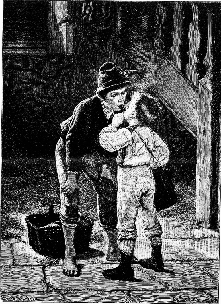
Nicht brotbringende Bunt!

hätte ich doch gerne gewußt, wie die Kinder in ihrem Gebetbüchlein Auskunft wissen. Ein Kind hat während dem Gottesdienst viel in seinem Buche herumgeblättert. Dem Aemchen kann ich sagen, daß es gestern lange Inhaltsregister studiert hat und Rosa hat heute in meiner Nähe „Gebet bei einem Gewitter“ gelesen, grad als das Glöcklein zum Sanctus geläutet hatte. Da machen nun freilich die Kinder große Augen, wie das alles ans Tageslicht kommt. Manches Kind weiß gar keinen Bescheid in seinem Buche. Man gibt ihm dasselbe in die Hand und schickt es damit zur Kirche und ob es nun am Abend die Messandacht lese und am Morgen in der hl. Messe das Abendgebet verrichte, darum bekümmert man sich nicht. Eine Lehrerin, die ihr Plätzchen in der Kirche bei der Kinderschar hat, zudem über zwei scharfe Augen verfügt, kann auf diesem Gebiete stets neue Erfahrungen machen und manche Mutter würde staunen, wenn man sie darüber aufklären würde, vielleicht auch — sich ein