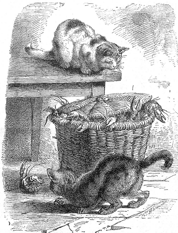
Wizi bleib bei deinem Triff!

Kata, in ihrer erster Jugend ein zartes, niedliches Püppchen, hatte einst als die Schönheit der Familie gegolten und war bei jeder Gelegenheit in den Vordergrund gedrängt worden. Sie