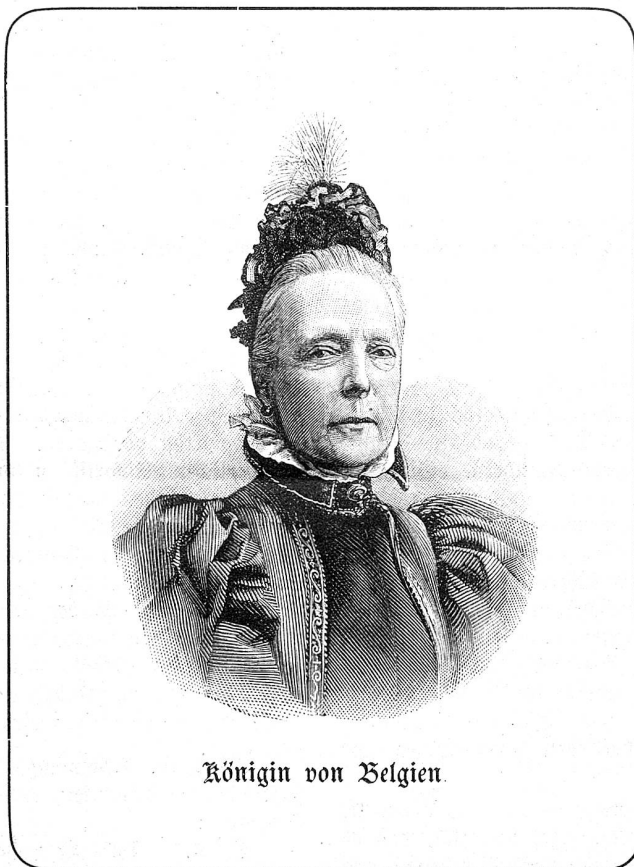
Königin von Belgien.

Lehtern dieselbe heimtrugen. Also, man scheue die kleine Mühe nicht, jedweden Rest unverweilt aus dem Krankenzimmer zu entfernen, eventuell zu vernichten.