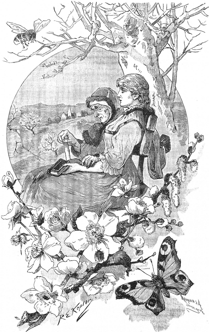
Wer feiert die frühesten Ostern!

Sie haben die ausgebreiteten Arme des Mahners am Kreuze mit den blutenden Wunden und der Dornenkrone noch nicht verstanden, noch schlummert etwas in ihnen der Auferstehung entgegen.