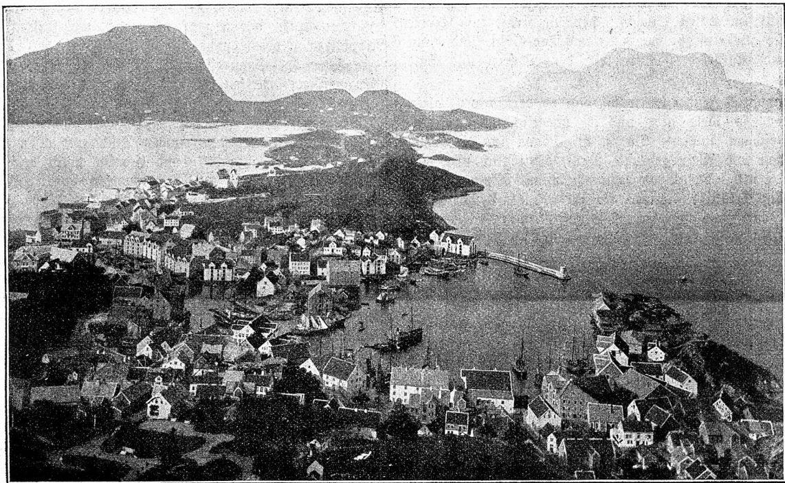
Zur Brandkatastrophe in Alesund (Norwegen): Ansicht der Stadt vom Berge Afsel aus.