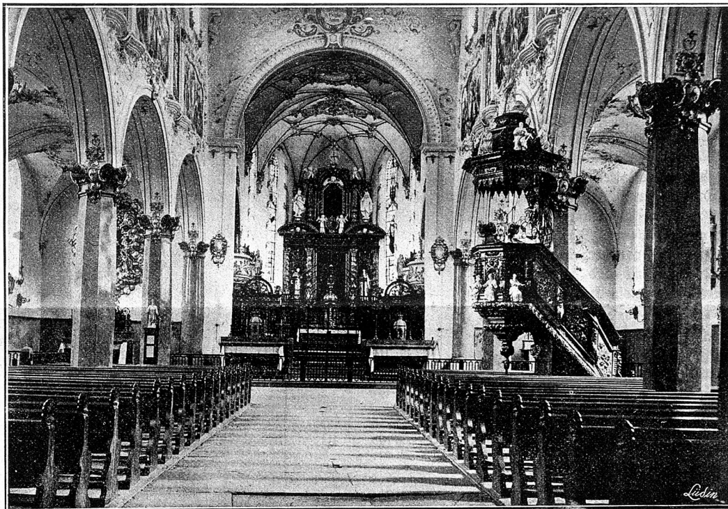
Maria Stein: Inneres der Wallfahrtskirche.

Die Calendula sollte in keinem Hause fehlen. Sie ersetzt das Sublimat, das Karbol, das Lyso und wie alle die giftigen