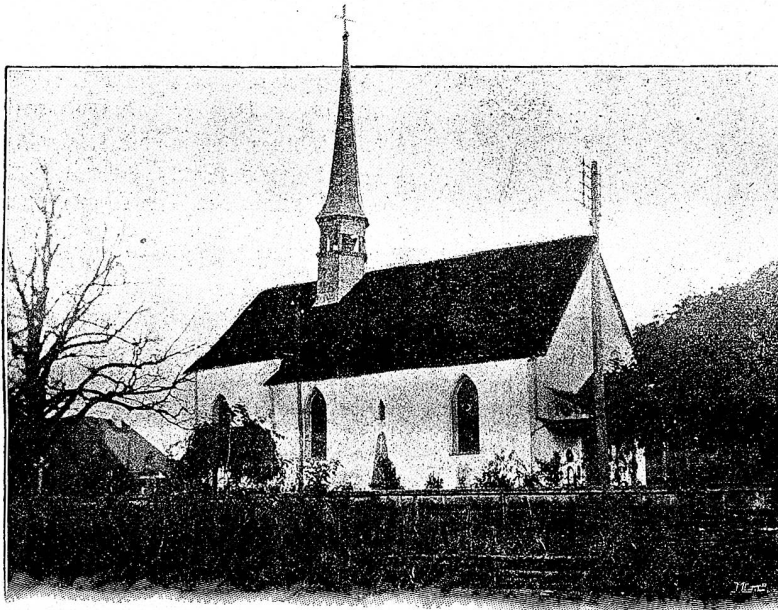
Kirche in Zuchwil bei Solothurn.

Wie leicht und frei atmete die Sängerin auf im Genusse der spärlichen Strahlen. Aber selbst diese wenigen verklärten ihre hübsche Erscheinung mit goldenem Schimmer und immer heller quoll das schöne Weihnachtslied „O hehre Nacht“ von Adams aus der Brust der jetzt fröhlich gewordenen Tochter. Ein prächtiger Ausdruck trat auch in des Fräuleins Züge, als sie mit feierlicher Betonung sang: „Fallt auf die Kniee, der Himmel steht euch offen; — o hehre Nacht, du gabst uns ew'ges Heil.“