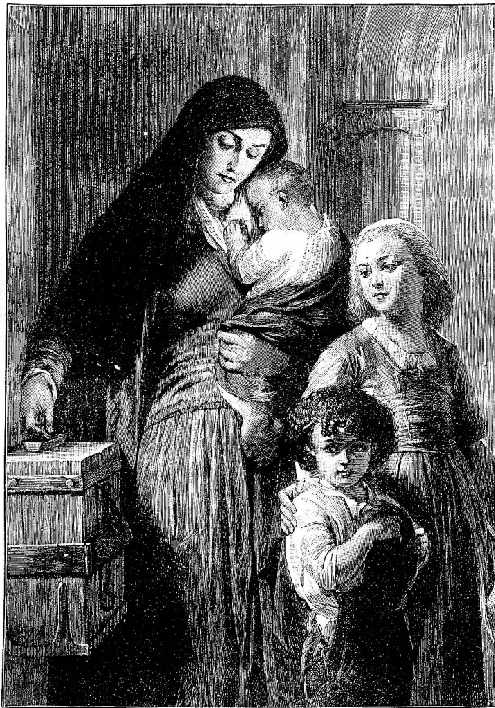
Der Witwe Pfennig.

Sie ließ ihm darum Zeit, sich etwas zu fassen, dann leitete sie das Gespräch langsam auf andere Dinge über. Zulezt erbot sie sich zur Beantwortung der englischen Einladung, wohl wissend, daß es dem Vater nicht mehr so leicht sein werde, in dieser Sprache zu schreiben. Zugleich wollte Minna dabei einen zwar ausgefuchst höflichen, aber doch entschiedenen Ton anschlagen, damit, wie sie hoffte, für ein und allemal jede weitere Annäherung unterbleiben sollte auf Seite des protestantischen Bewerber's. Sie fand auch bald das passende Wort und las es dem Vater vor. Dieser freute sich über des l. Töchterchens