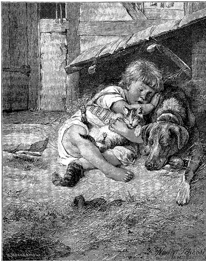
Ein friedliches Aleeblatt.