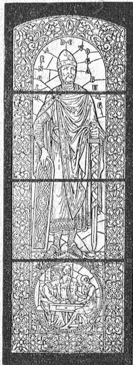
Arnold von Vobburg. Ausgeführt für die Stiftskirche zu Tegernice.

Nachfolger von Gebr. Karl & Nikolaus Benziger.