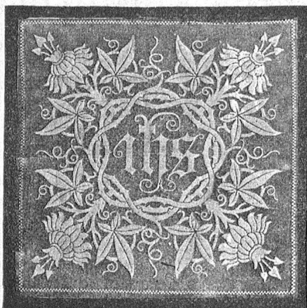
Dessin No. 410 zu

48 □ cm. per Dutz. Fr. 34. — = M. 27.20 stückweise » 2.90 = » 2.30