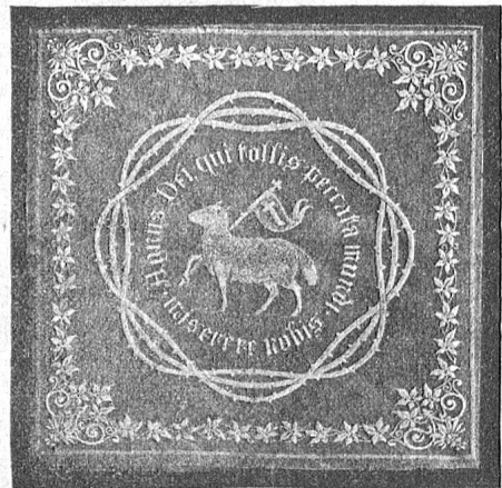
Dessin No. 453 zu

Dasselbe mit der ganzen Passion Jesu Christi in der Bordüre eingewebt, hat vor allen andern den Vorzug, dass es in der Mitte keine Symbole enthält, sondern glatt ist. In Bezug auf Ausführung steht es unerreicht da.