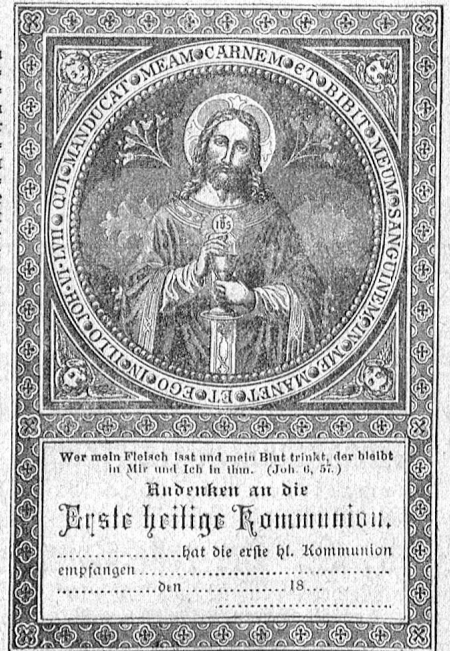
Verkleinerte typogr. Abbildung von No. 13564.

Wir bitten, Muster und Special-Katalog zu verlangen!