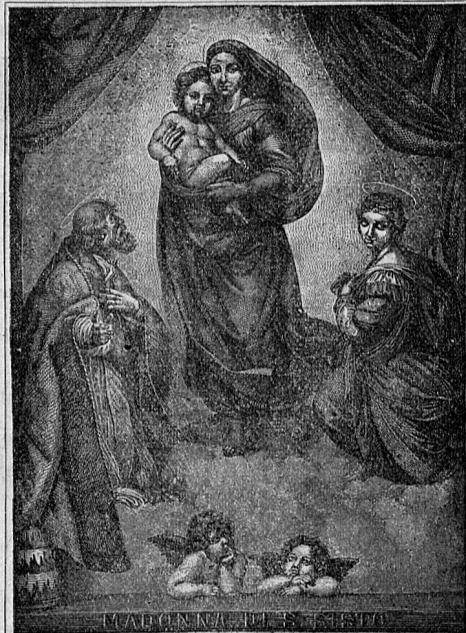
Verkleinerte Abbildung des Chromo-Titelbildes.

Das sind die bisherigen Leistungen von „Alte und Neue Welt“, auf welche Redaction und Verlag mit dem Bewußtsein redlichen Strebens zurückblicken dürfen und