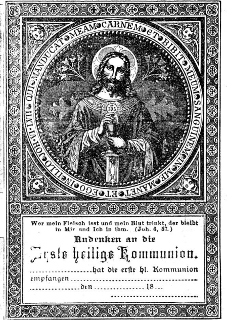
Verkleinerte Abbildungen von z. o. 13220 und 13564.