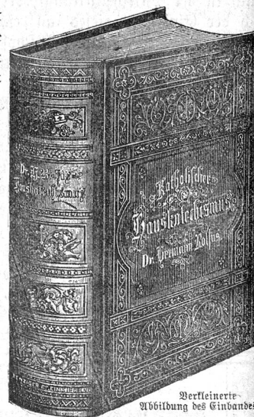
Verfeinerte Abbildung des Einbandes.

Der erprobte Name des Autors läßt etwas Gediegenes erwarten. Die Darstellung der christlichen Lehre ist einfach, populär und anziehend; der Inhalt reichhaltig und praktisch. . . Der weitesten Verbreitung empfohlen.